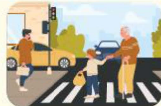
مساعدة كبار السن