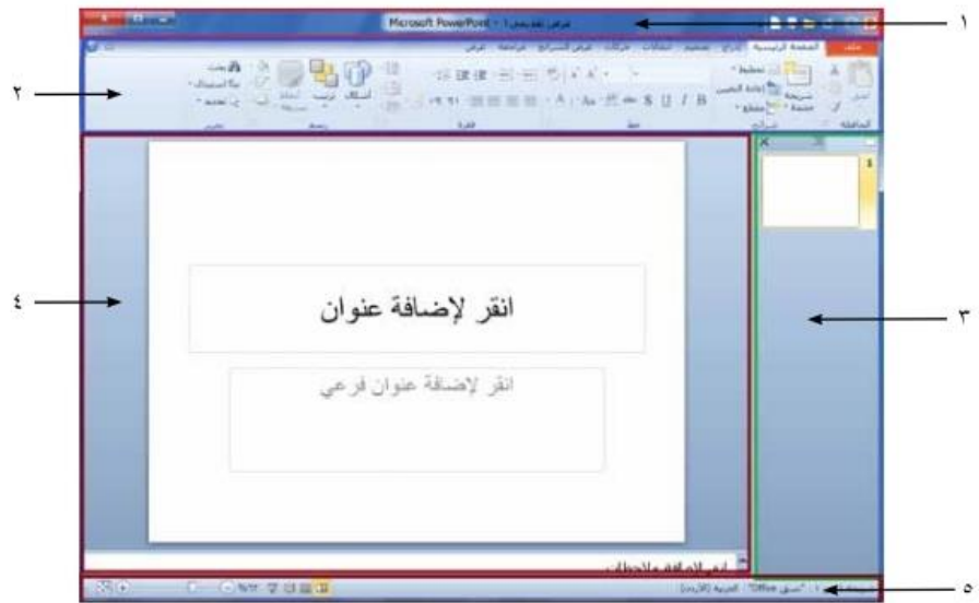
الشكل (٣-١): الشاشة الرئيسية لبرمجية (PowerPoint 2010).